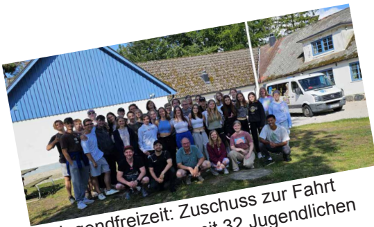
Jugendfreizeit: Zuschuss zur Fahrt nach Schweden mit 32 Jugendlichen