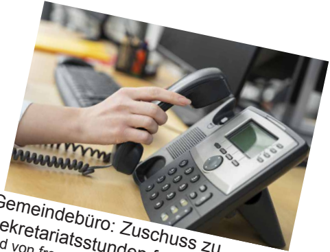
Gemeindebüro: Zuschuss zu Sekretariatsstunden für Erreichbarkeit