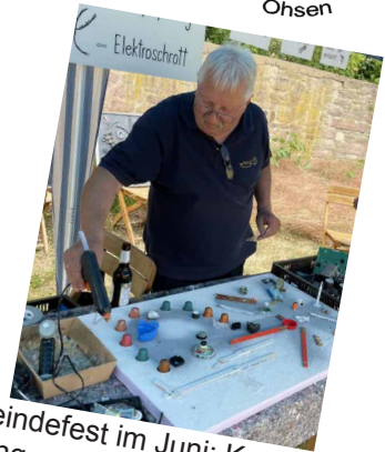
Gemeindefest im Juni: Kreativaktion für Jung und Alt, Elektroschrottbilder kleben. 1 Bild erhielt die katholische Kirchengemeinde, 1 Bild die Petri-Kirchengemeinde