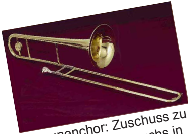
Posaunenchor: Zuschuss zu den Kosten des Besuchs in der Partnergemeinde Trünzig