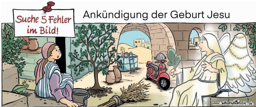
Froschkönig, Pool, Vespa, Kaktus, Lichterkette