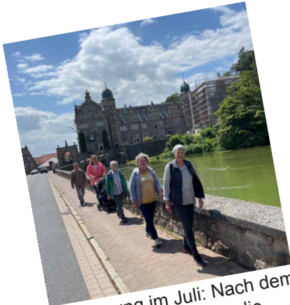
Wanderung im Juli: Nach dem Gottesdienst starteten die jungen und älteren Wanderer nach Hämelschenburg