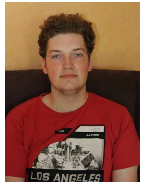
Jugendarbeit: Zuschuss zur Finanzierung der Stelle des Bundesfreiwilligendienstes

Die Stiftung fördert die kirchengemeindliche und diakonische Arbeit in unserer Kirchengemeinde.