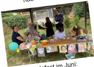
Gemeindefest im Juni: Aktion Kinderschminken